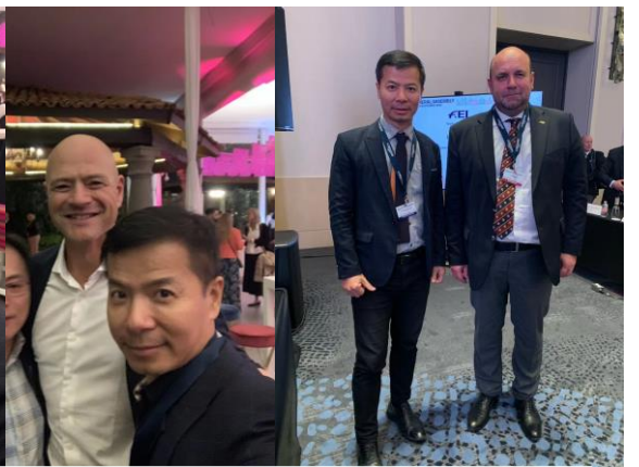
我國出席代表利用各種場合，積極主動地和歐洲、亞洲、美洲等五大洲出席代表建立私下情誼

謹依教育部體育署委託中華奧林匹克委員會辦理國際事務接班人養成計畫執行辦法暨申請作業程序規定相關規定提出計畫經費之申請，並聲明就申請、請領及核結計畫經費所提出之所有申請表單及文件及資料內容均屬真實而無虛偽不實，並承諾就辦理本計畫相關之審議及經費之審查、支用及核結等事項，願遵守前揭辦法相關規定辦理，其嗣後有所修正者，亦同。