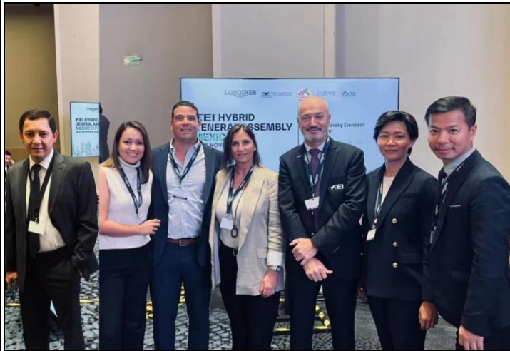
我國出席代表(右一)和南美洲出席代表互動熱絡