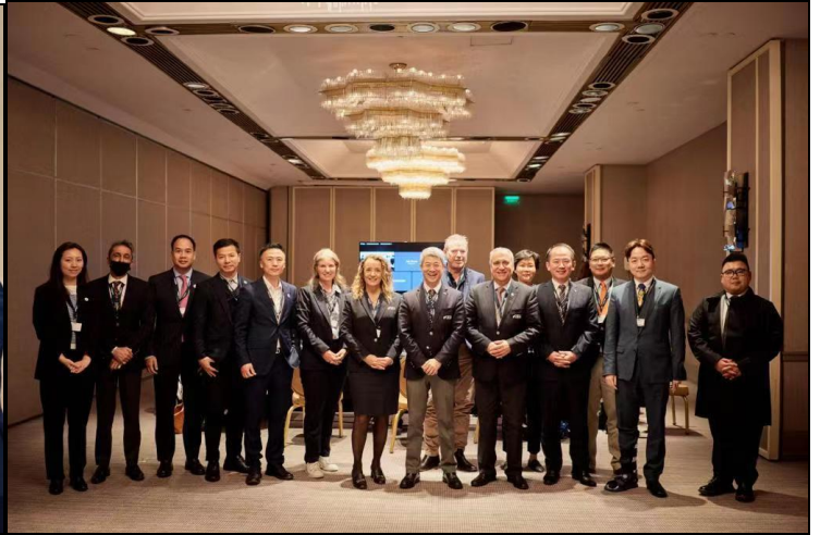
我國出席代表(左四)和國際馬術總會第八分區出席會員代表合影